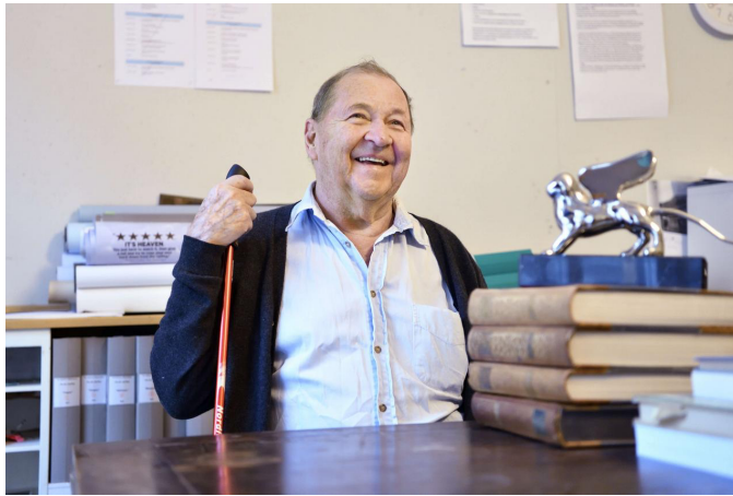
En av landets mest kända filmregissörer, Roy Andersson, flyttar ner delar av sin studio i Stockholm till Skillingaryd.